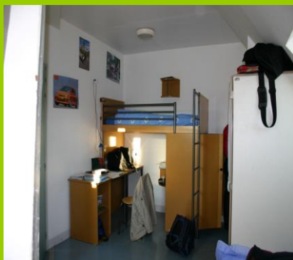
Chambre de l'internat